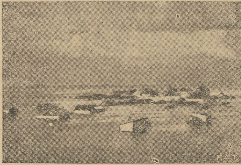
Oto widok jednego z przedmieść Charbina, zalanego przez wezbrane fale.