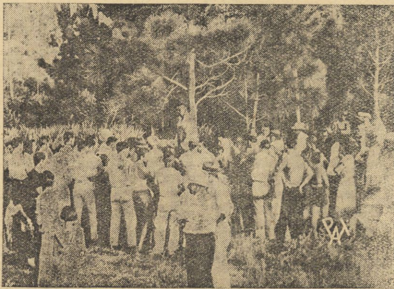
Murzyn amerykański, który zniewolił białą kobietę został przez tłum napadnięty i zabity, a następnie powieszony na drzewie. Zdjęcie nasze przedstawia — wystawione na widok publiczny zwłoki murzyna, ofiary linczu.