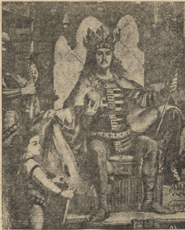
WŁADYSŁAW WARNEŃCZYK. Według obrazu Matejki.

SOFJA. (Pat.) Wczoraj wieczorem król Borys przyjął ministra Jędrzejewicza w pałacu eulinogrodzkim i udekorował go wielkim krzyżem orderu św. Aleksandra.