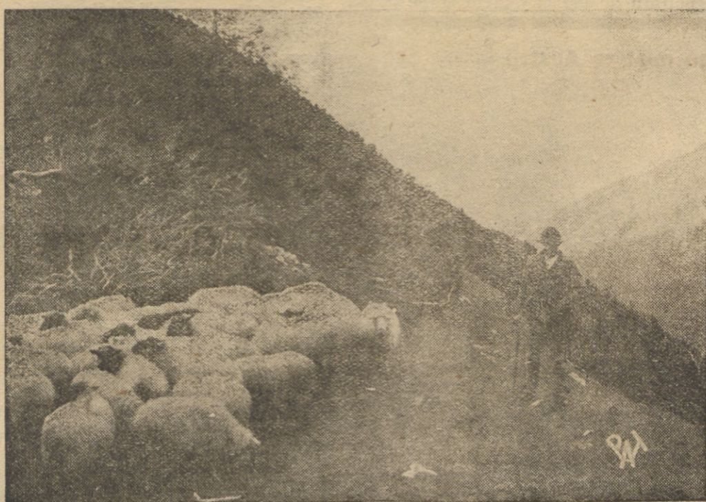
Z nastaniem zmierzchu juhas spędza z gór stadoowiec.