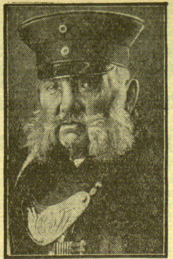
Dreimal um die Erde gelaufen

Lehnen Endes hängt aber jede Abwendung von Wetterkatastrophen von der Beobachtungsgabe, den Erfahrungen und Kenntnissen des Führers eines Luftschiffes ab; von auswärts kann ihm nur Material für das Verständnis der Wetterlage gegeben werden. Er selbst muß hiernach seine eigenen Wind- und Wolkenbeobachtungen deuten. Er hat zu entscheiden, ob er einem Sturm- oder Böengebiet rechts oder links ausweichen muß, ob er längere Zeit in einer Nebelzone bleiben kann und ob für Ausgleich der elektrischen Spannungen an seinem Luftschiff zu sorgen ist. Dr. Eckener hat dies kurz und klar mit den Worten ausgedrückt: „Luftschiffnavigation ist im wesentlichen meteorologische Navigation“. Hoffen wir, daß das Dr. Eckener gelingt, viele Schüler in seine Kenntnisse meteorologischer Navigation einzuführen. Das ist der beste Schutz des Zeppelin-Luftschiffes gegen Witterungsgefahren.