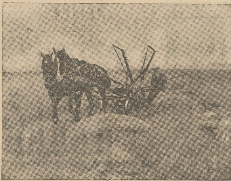
Zniwa tegoroczne zapowiadają się dobrze mimo, że ze względu na niskie ceny plodów nie mogło wielu rolników użyć przy uprawie roli dostatecznej ilości nawozów sztucznych. Na ilustracji naszej widzimy konną zniwiarkę w pełni pracy.