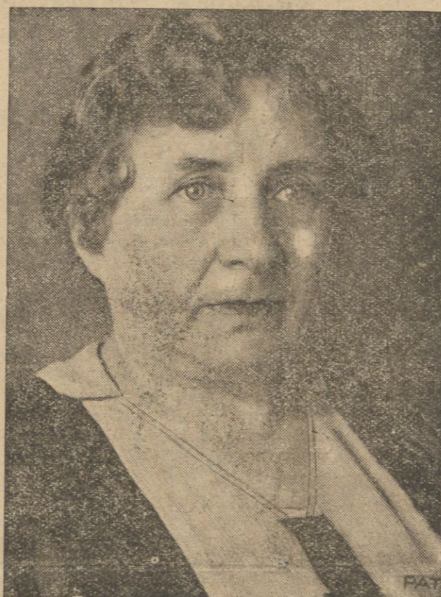
Ostatnia fotografia ś. p. Michaliny Mościckiej, Małżonki Pana Prezydenta Rzplitej.