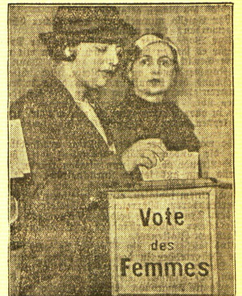
Probewahl für das Frauenwahlrecht in Frankreich

Kalbshirn in Muscheln. Gefochtes Kalbshirn wird in kleine Würfel geschnitten und mit einer italienischen Soße in Muscheln überbacken.