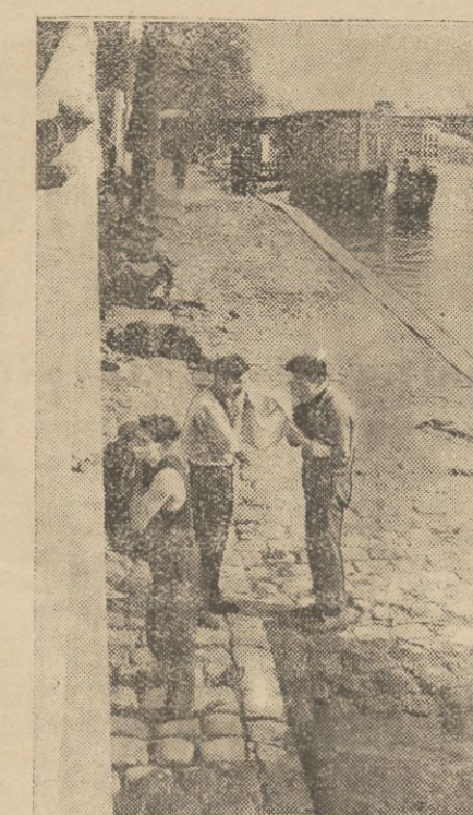
Na zdjęciu naszym widzimy charakterystyczny obrazek paryski. Grupa bezrobotnych od bywa ranną toaletę na bulwarach Sekwany.