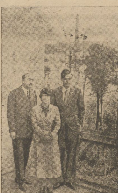
Znakomity lotnik amerykański. Lindbergh bawił w tych dniach z małżonką incognito, w Paryżu. Na zdjęciu państwo Lindbergh na tarasie ambasady Stanów Zjednocz. w Paryżu w towarzystwie przedstawicieli ambasady.

LES MUREAUX PAT. — Płk. Lindbergh z małżonką odlecieli w dniu 2 b.m. o godzinie 12,20 w kierunku Amsterdamu.