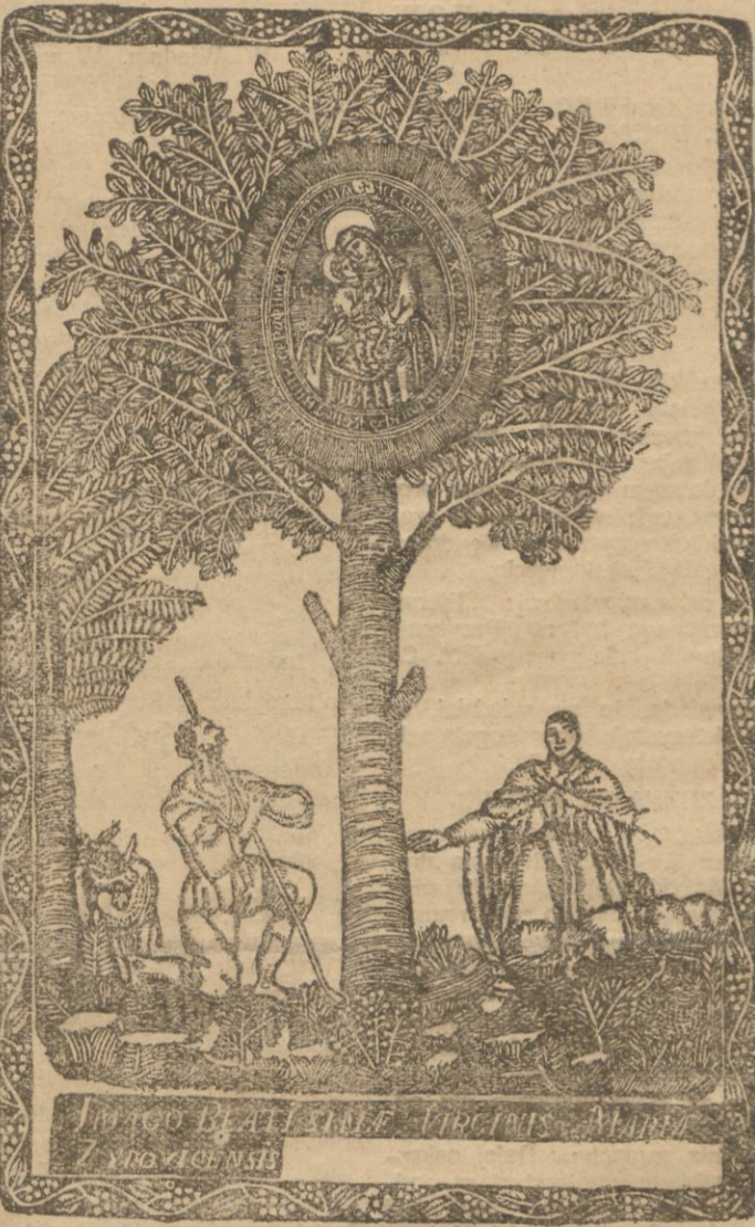
Pastuszkowie przy drzewie.

Operacja tego Obrazu jest szczerze żłoto, w kolo niego o perculum, w którym kryształ jest wprawiony w jeden rząd diamentami sadzone, a na wierzchu Koroneczka, tak że diamentami sadzona. Insze drogie klejnoty i perły zdobią cały Oltarz, w którym wprawiony jest Obrazek.