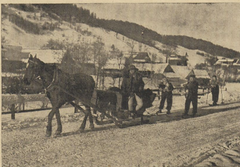
Jazda na nartach za saniami cieszy się wielkim powodzeniem w obecnym sezonie zimowym w Zakopanem.