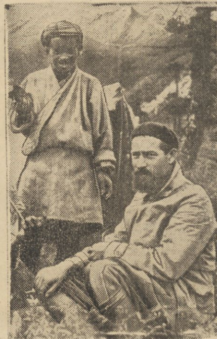
Bernardyni w Himalajach

Gdy się pomyśli o cieniutkiej skorupce litosfery i przepiętnej dynamice pyrosfery, łatwo się zrozumie, iż żyjemy właściwie na wulkanie. Bodaj we wszystkich częściach świata i we wszystkich epokach dziejów dawalo się tę prawdę zaobserwować. Pomiędzy już nawet ową odległą erę, kiedy nasza „kropla błota“, „une goutte de boue“ — jak powiada A. France — świeżo oderwana od słońca była jeszcze ognistą kulą, stygnącą w lodowatych przestworzach międzyplanetarnych. Weźmy czasy znacznie późniejsze. Oto zapada się legendarny ląd Atlantydy, łączący dzisiejszą Amerykę z dzisiejszą Afryką. Zapada się ląd, łączący Afrykę Wsch. z Persją. Zapada się ląd pomiędzy Azją Południową a Australją. Jako ślady tych potężnych kataklizmów pozostają wysepki (Kanaryjskie, Azorskie, Maljarskie i t. d.), podwodne łańcuchy górskie, no i zabytki kulturalne, wraz z analogiami lory i fauny. Już za naszych historycznych czasów pograżyły się w morze osie dla i świątynie (Włochy), a wyłoniły się nowe tereny (Szwecja). Jakże często okręci, płynący po Pacyfiku natyka się na wysepki, której przed kilku dniami czy godzinami w tem miejscu nie było. Jakże często wylatuje w powietrze lub poprostu pograża się w toni wysepka, która tkwiła w danym miejscu całe stulecie. — Żyjemy, jak na wulkanie, wśród groźnych żywiołów twórczych i nieszczęśliwych. NEW