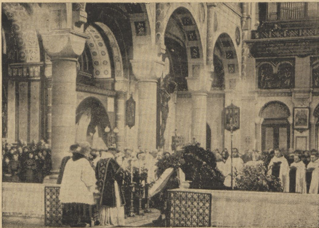
Wnętrze starożytnego kościoła Karmelitów bosych w Wiedniu. Na zdjęciu obchód uroczystości „Świętej Rodziny“.