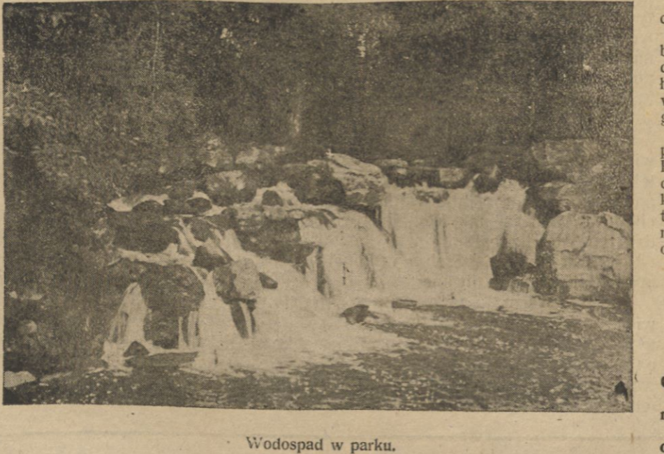
Wodospad w parku.