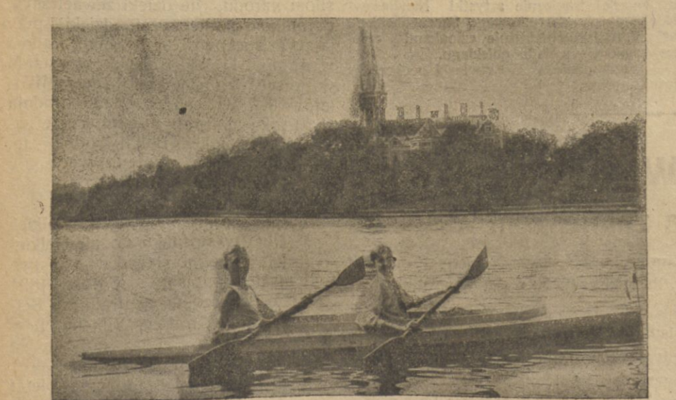
Kajakami po jeziorze

Landwarów... przed wojną każdy go znał w Wilnie pasażer podmiejs- kich pociągów: „W Landwarowie naj- ładniej, najsuszej, najwygodniej” Zawsze jakiś superlativus poprze-