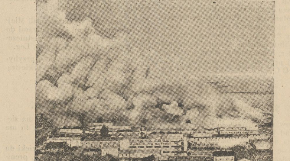
W dniu 13 b. m. wybuchł groźny pożar w popularnym Luna-Parku w Coney Island pod New Yorkiem, położonym nad brzegiem Atlantyku. Rozszalały żywioł zniszczył 2 bloki domów, kąpielisko i autodrom, wyrządzając straty na przeszło milion dolarów. Ilustracja nasza przedstawia widok pożaru, zdjęty z samolotu.