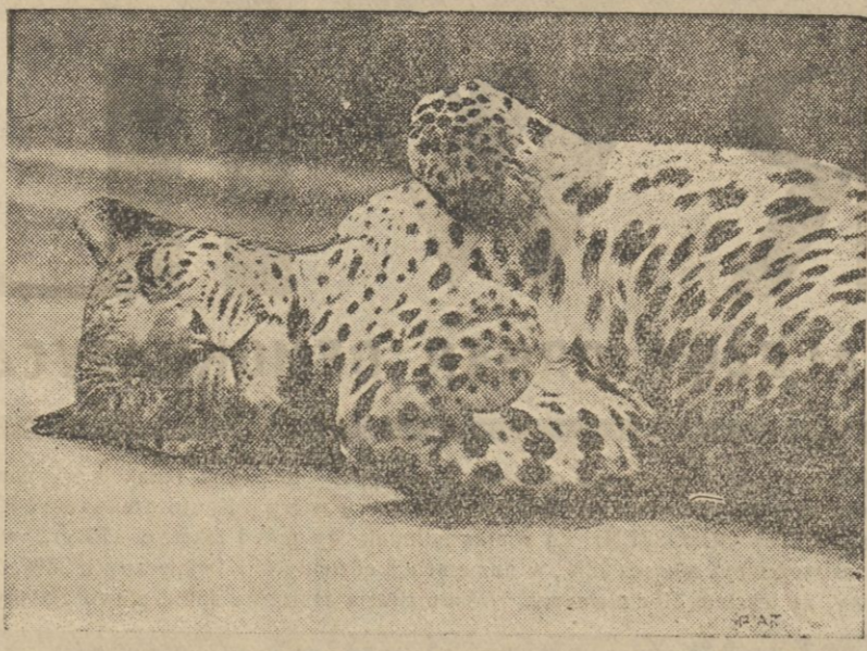
Na zdjęciu naszym widzimy młodego tygrysa Maudy z ogrodu Zoologicznego w Londynie w czasie poobiedniej drzemki.