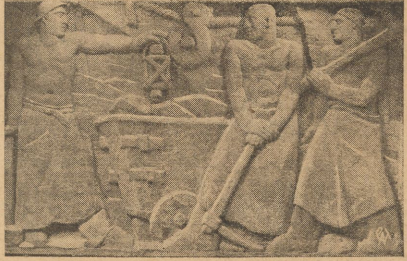
Dwie płaskorzeźby z cyklu „Ekspansja Polski“ dłuta St. Rzeckiego, przeznaczone dla Pawillonu Polskiego na Wystawie Międzynarodowej w Brukseli. I-sza przedstawia „Wiosnę“, II „Górnictwo“