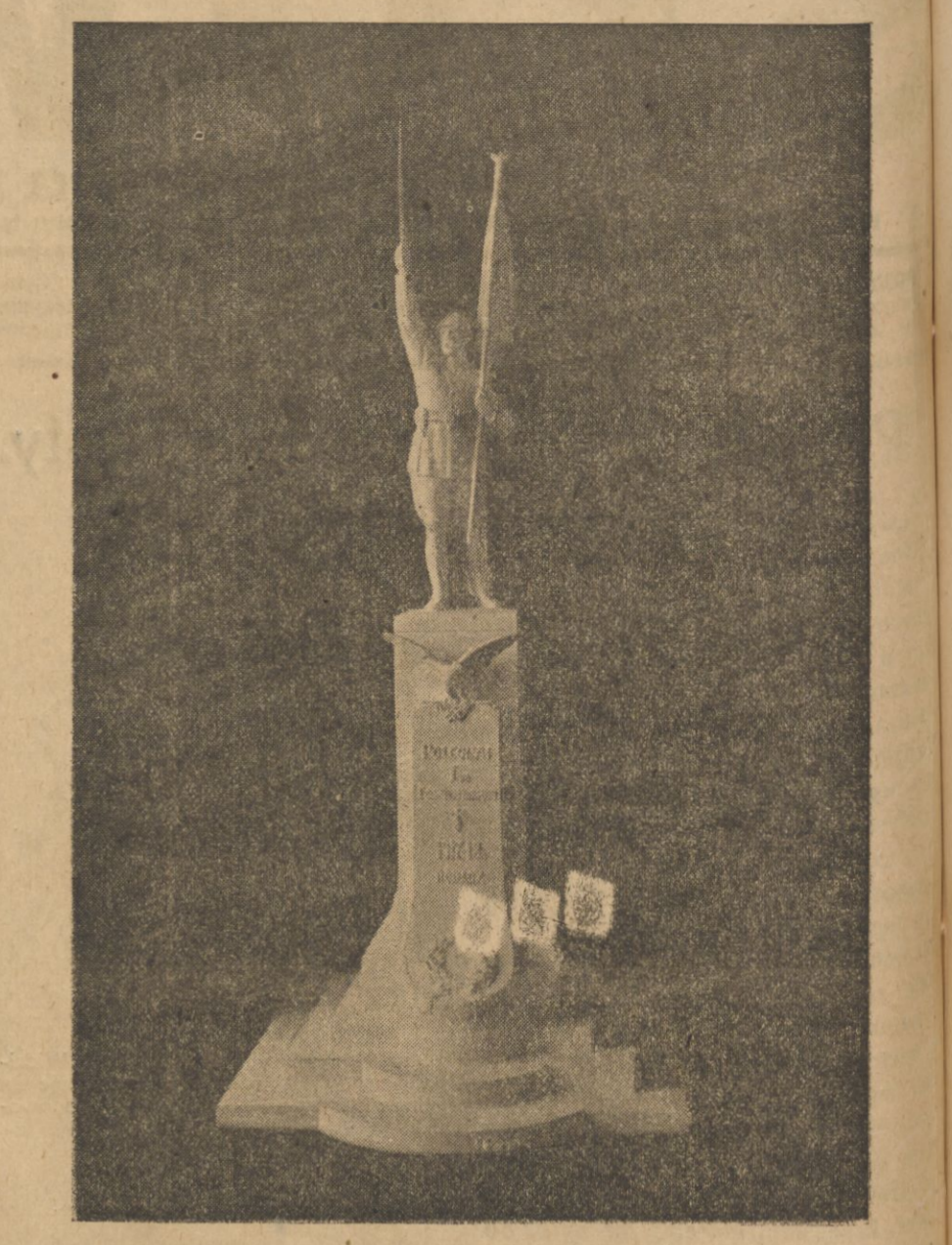
Pomnik wykonany w gipsie, oddany już do odlewni.