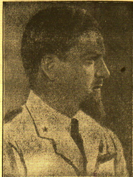
Balbo, Oberstkommandierender der italienischen Mittelmeer-Luftstreitkräfte

Newyork, 9. September. In der Nähe von Cape May in New Jersey holten mehrere Küstenwacht-schiffe ein englisches und drei amerikanische Motorschiffe ein, die Alkohol im Werte von 200 000 Dollar an Bord hatten; 20 Mann wurden verhaftet. Es ist dies der größte Fang von Alkoholschmugglern, den die amerikanische Behörde seit Aufhebung der Prohibition machte.