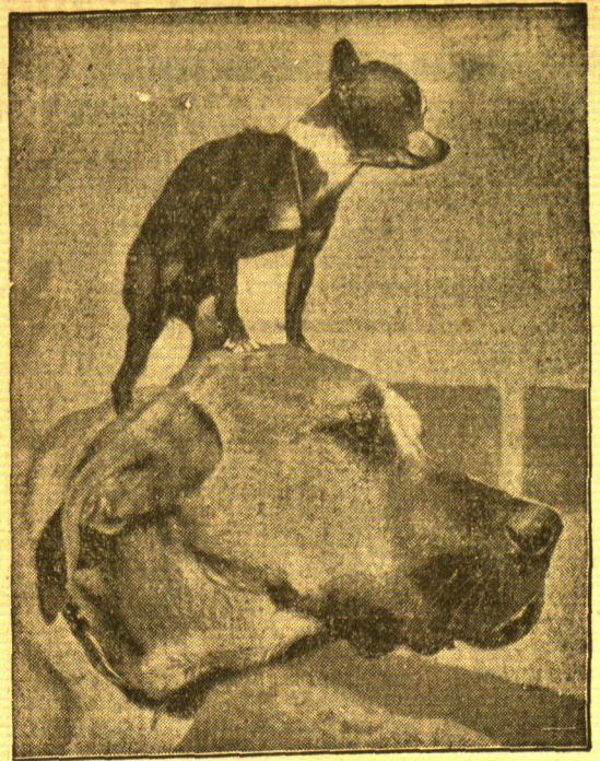
Aufs Dach gestiegen

Es ist, wie jedes Jahr, sehr viel Klatsch über Greta Garbo verbreitet worden. Man hat behauptet, daß sie sich nach ihrem nächsten Film ins Privatleben zurückziehen werde. Nun kommt aus Hollywood eine neue Nachricht, die besagt, daß der letzte Film der Schwedin, über deren Vergangenheit das Dunkel der Wiberiprüche liegt, eine Autobiographie sein soll. Greta Garbo spielt „Greta Garbo“. Das ist vielleicht die Film-Sensation des nächsten Winters.