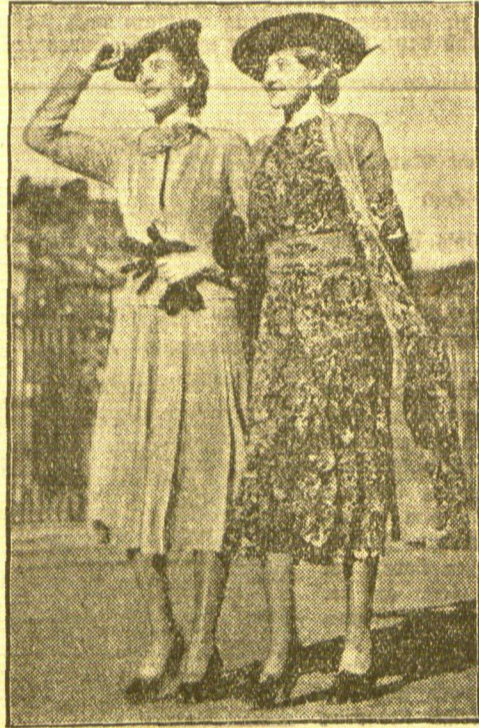
Blütenmuster — Blüten des Sommers

Der kurze Puffärmel paßt stets zum Schleierstoffkleid, ebenso sicher auch ein kurzes Veilchen, oder für Jungmädchen eine Schulterpasse oder gewinkelte Obertheile, denen weitwuschelnde Röcke angelegt werden. Beim Zusammenlegen der Teile kann man gezeigte schmale Rücken mittelfen, doch sind pliffierte nicht zu empfehlen, da sie sich schwerer nach dem Waschen plätten lassen. Meist weisen schon die Mütter die Verarbeitungsform, denn es ist wohl selbstverständlich, daß sie bei einem so dünnen Stoff klar wirken müssen und ihre größeren Teile nicht zu dicht gereiht werden dürfen. Scharf gebügelte Falteenteile werden von links mit großen Stichen unsichtbar zusammengehalten — nur unten läßt man sie auszuweichen. Vliese und Heidsam werden gemockte Paffen und Taillen sein, Schleifen- und Schärpengerüstungen aus Seiden- oder Samtband. Da von Mädchen wieder Haarschleifen und von Jungmädchen Frisurbänder getragen werden, entstehen mit Schärpen und Gürteln hübsche Uebereinstimmungen. Als weitere Garnierung nimmt man zu gemütern Schleierstoffen passende einfarbige Blenden, Ärmelchen oder Zwischenteile und stoffbezogene Knöpfe. Einfarbigen Schleierstoffkleidern kann man bunte Ribben zwischenlegen oder die Ränder mit Zäckenborten begrenzen. Auch andersfarbene Volerojackchen sehen jugendlich und nett aus. mkk.