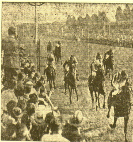
Das Deutsche Derby in Hamburg-Horn