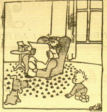
Nun hat Vater endlich seine Ruhe.