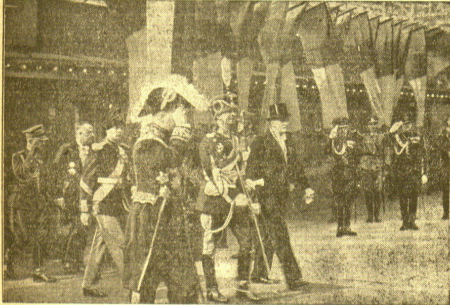
König Carol von Rumänien in Warschau

Der rumänische König ist in Begleitung des Kronprinzen Michael zu einem Besuch der polnischen Hauptstadt in Warschau eingetroffen und wurde auf dem Bahnhof von dem Staatspräsidenten Moscicki und den Spitzen des Staates empfangen. Links: Hier steht man König Carol, rechts von ihm Staatspräsident Prof. Moscicki gefolgt von Kronprinz Michael, nach der Ankunft auf dem Zentralbahnhof in Warschau — Rechts: Während der großen Parade vor dem königlichen Quartier, an der mehrere Divisionen teilnahmen. Rechts: König Carol mit dem polnischen Staatspräsidenten Moscicki; weiter nach links der rumänische Thronfolger Kronprinz Michael und Marschall Rnd-Smigla.