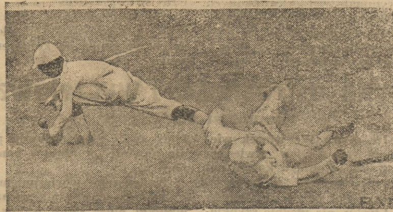
Base-ball, narodowa gra amerykańska zyskała po drugiej stronie Pacyfiku wielką popularność.