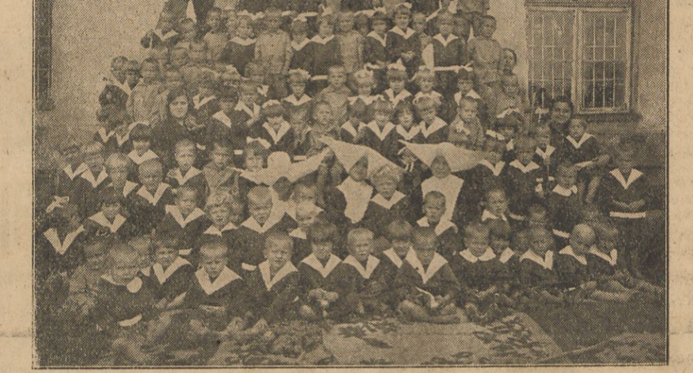
Grupa wychowanków Domu Dzieciątka Jezus (wiek przedszkolny)

ty z pomieszczeniem dziatwy, koszem 10 ty sięczy złotych zrobiliśmy z nich pawilon. W ten sposób udało się ulokować kilkadziesiąt dzieci, takich, które wyszedłszy z niemowlęctwa, zaczynają mówić i chodzić. — Czy zakładowi zwrócone zostaną pieniądze wydane na ten „ruch budowlany” — nie wiemy W. w każdym razie nie myślałyśmy o tem na względzie mając troskę o rozszerzenie naszych murów. Trudno jest po jednym, krótkim pobycie w Domu Dzieciątka Jezus w jednym sprawozdaniu dać plastyczny obraz tego, co się w nim robi, co stanowi całokształt jego potrzeb. Dłatego pisząc niniejsze, miałem na myśli tylko zagadnienie najważniejsze, tylko momenty pracy S.S. Szarytek, które mi najbardziej widoczne się wydały. Najważniejszym zagadnieniem Domu Dzieciątka Jezus jest w tej chwili potrzeba zgromadzenia funduszy na remont walcących się murów, co dla setek maleństw pozabawionych rodziców i zdanych na łaskę losu, przytułek i schronisko stanowią. Fundusze te musi zebrać społeczeństwo do którego za pośrednictwem mego nieudolnego pióra Zakład się zwraca. Inicjatorem rubryki ofiar „na remont sal w Domu Dzieciątka Jezus” jest nasz arcybiskup, to napemnia nadzieję, że nie będzie ona w „Słowie” głucha. Za zaszczyt sobie poczytuję, że mogę tę rubrykę rozpocząć mą skr omną ofiarą i że mam możliwość zachęcić innych do składania datków na cel sam przez się polecenia nie wymagający. Mik.