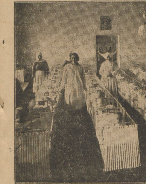
Jedna z sal dla niemowląt w Domu Dzieciątka Jezus.

— Inne schroniska mogą powoływać się na miejsca, w naszych zakładach i nie przyjmować podrutków, my już nie mamy do kogo je odsyłać. — Na jakich funduszach opiera się egzystencja Domu Dzieciątka Jezus? zadaje pytanie. — Na każde dziecko otrzymujemy dotację Magistratu w wysokości 70 zł. miesięcznie dla dzieci do lat 3 oraz 35 złotych — dla dzieci powyżej tego wieku. Poza to korzystamy z dotacji 580 złotych miesięcznie od rządu. — Z tych sum musimy wykrzesać środki na wyżywienie i ubranie dzieci, opłatę służby, inwentarz, konserwację gmachów, lekarzy, medykamenty, światło, opał — słowem wszystko, wszystko. — Ponadto, rozszerzając zakłady, wyjąłszy w 1926 r., posesję przy ul. Subocz 23 i placiny za nią rządowi komorne, w kwocie około 3.700 zł. rocznie. — Ubiemy wychowanków naszych z