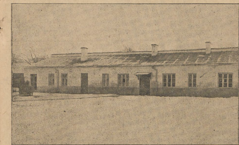
Nowy pawilon, wybudowany przez Dom Dzieciątka Jezus własnymi środkami.