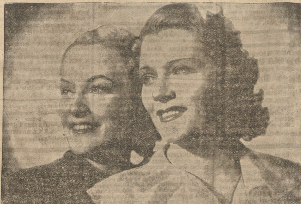
Dwie znane gwiazdy filmowe — Irena von Meyendorff i Olga Czechowa — których fotografie widzimy wyżej, kreują głównie rolę, jako matka i córka, w najnowszym filmie „Dwie kobiety”.