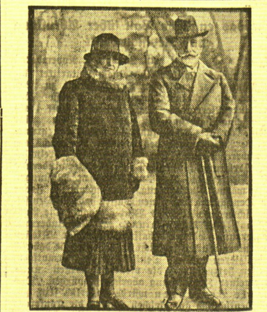
Zum zehnten Hochzeitstage des deutschen Kaisers Kaiser Wilhelm II. vermählte sich vor zehn Jahren — am 5. November 1922 — in zweiter Ehe mit Prinzessin Hermine v. Schöenburg-Carolath.

wtb. London: Die „Neute“ mitteilt, wird die englische Regierung in mehrer nach beendeter Beratung des Unterhauses über die Beschlässe der Ottawa-Konferenz mit Deutschland, den drei skandinavischen Staaten und mit Argentinien in Verhandlungen eintreten, um neue Grundlagen für den Handel zu beraten.