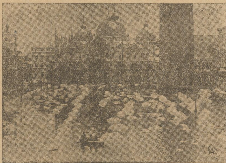
Fala mrozów, która przeszła nad całą Europą, nie oszczędziła także Włoch. W Wenecji wzbierane wody zalały plac św. Marka. Zdjęcie nasze przedstawia plac ten pod wodą, na której pływają większe i mniejsze grudy zlodowaciałego śniegu.