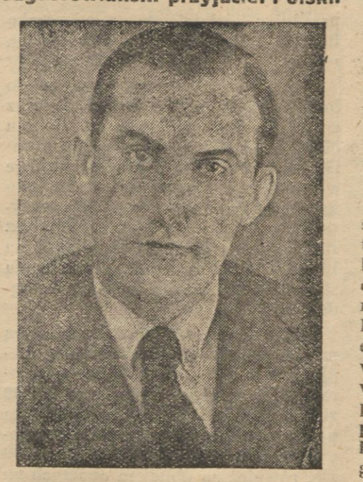
P. Rade Drainac, redaktor biłogrodzkiej „Prawdy”, wybitny literat i poeta jugosłowiański bawi obecnie w Polsce. Jest on autorem szeregu artykułów o Polsce z dziedziny politycznej i kulturalnej. P. Rade Drainac jest autorem wystawionej obecnie w teatrze narodowym w Biłogrodzie sztuki p. t. „Ważał trumien”. Podajemy jego fotografie.