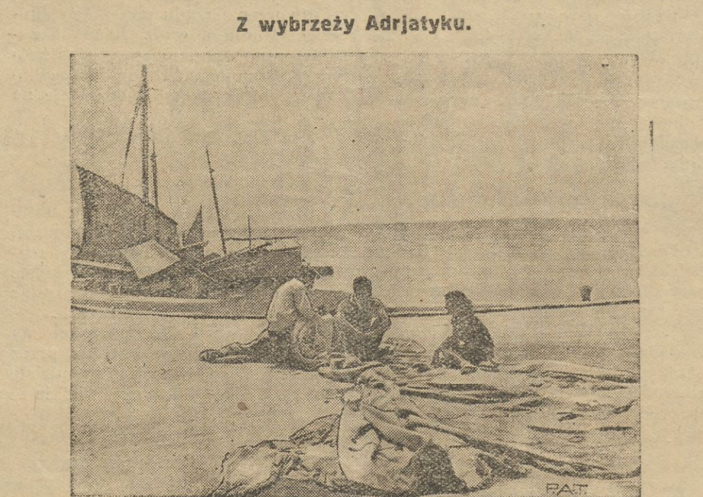
Naprawa sieci przed wyruszeniem na połow.