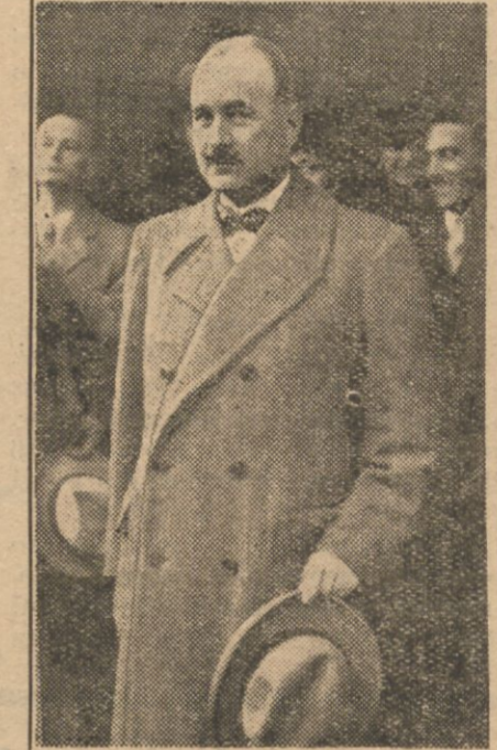
François Poncet, ambasador Francji w Berlinie, który przeprowadził z Hitlerem rozmowę.

ży raczej w Genewie, niż w Paryżu. Prasa angielska wspomina także o wyznaczeniu Herriota do prowadzenia rozmów bezpośrednich z Niemcami.