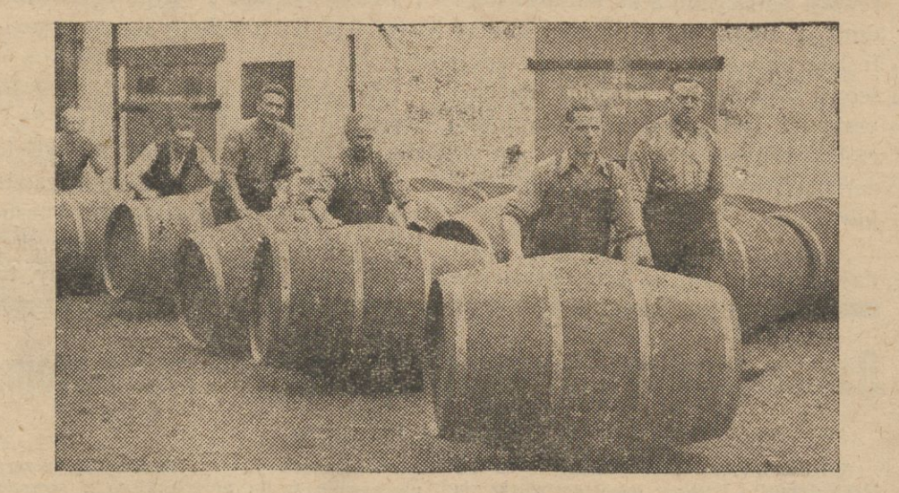
Popularny obrazek z Ameryki po zniesieniu prohibicji.

Sąd wydał wyrok, skazujący fałszywego lekarza — kobietę na 4 lata więzienia.