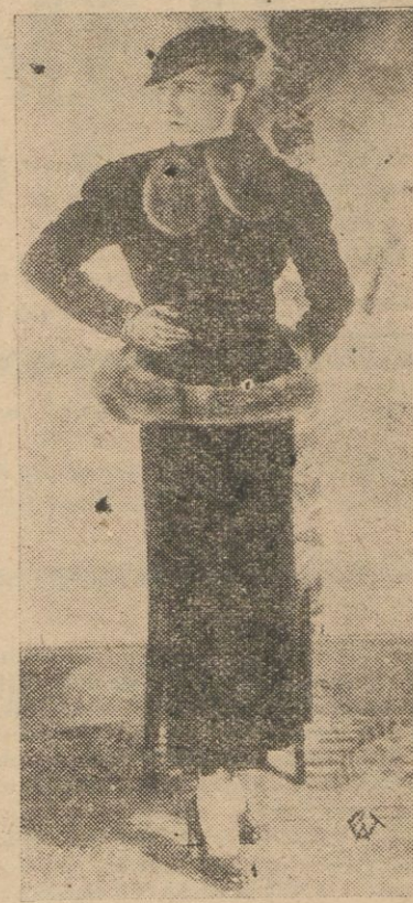
Najnowszy model na sezon zimowy 1933/34.