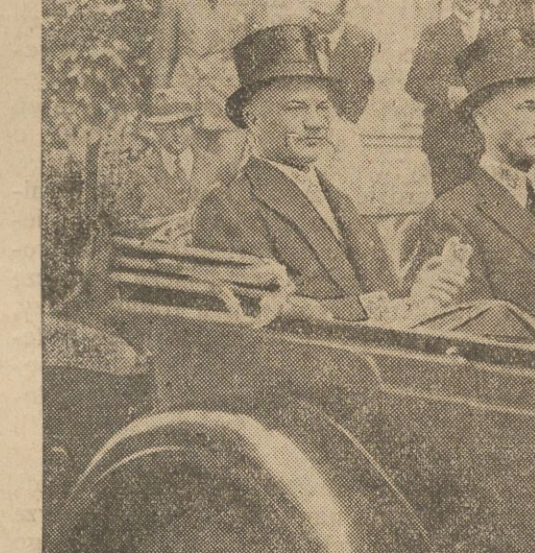
P. p. marszałek Sejmu Świtalski i marszałek Senatu Raczkiewicz, odjeżdżają samochodem z gmachu Sejmu na Zamek, aby zawiadomić Pana Prezydenta R. P. o jego ponownym wyborze.

strów Aleksander Prystor, Marszałek Świtalski zapytuje Elekta, czy przyjmuje urząd Prezydenta Rzeczypospolitej. Prezydent Mościcki odpowiada: „Przyjmuję”. Po odpowiedzi marszałek Świtalski prosi Elekta o złożenie przysięgi przed Zgromadzeniem Narodowym i wręcza mu tekst. Wśród napięcia i powszechnej uwagi padają słowa przysięgi: