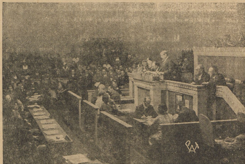
Tak powiedział premier Pierre Laval na posiedzeniu Ligi Narodów w Genewie. Oczy całego świata zwracają się w stronę Genewy z nadzieją, że konflikt włosko-abisyński zostanie jednak załatwiony na drodze pokojowej. Na zdjęciu premier Laval przemawia w Lidze Narodów.