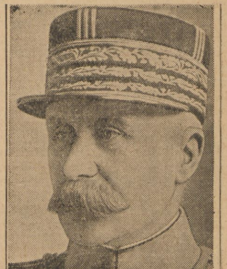
(Patrz art. na str. 4-ej)