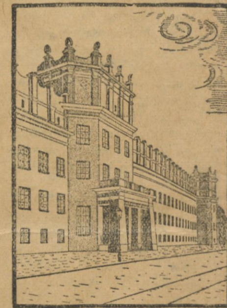
Fragment gmachu Wystawy rządowej na P. W. K.

Jeżeli chodzi o całość obrazową Powozach Wystawy Krajowej najwspanialej pod względem rozmachu architektonicznego przedstawia się t. zw. teren A (62.000 m2).