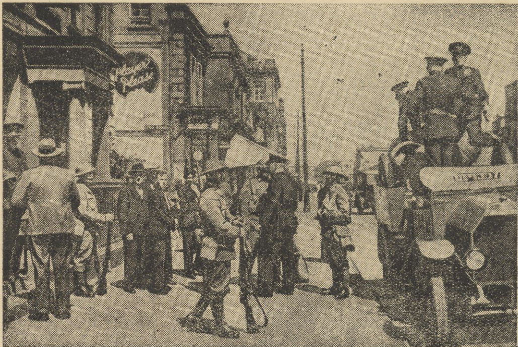
Od kilku dni trwają w Belfascie (w Irlandji) walki pomiędzy katolickimi narodowcami a anglijskimi protestantami. (Na zdjęciu patrol wojskowy i policyjny przed domem, w którym przeprowadza się poszukiwanie broni.)