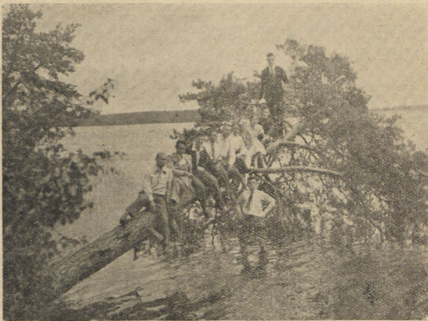
Robotnicy fabryki „Elektritu” nad Naroczą.

wchodzące w liczbę urlopów ustawowych. Fabryka dowozi własnymi samochodami urlopników nad jezioro, odległe o przeszło sto kilometrów i spowrotem, opłacając za nich pobyt w pensjonacie przez cały czas trwania urlopu. Dni robocze spędzone nad Naroczą nie