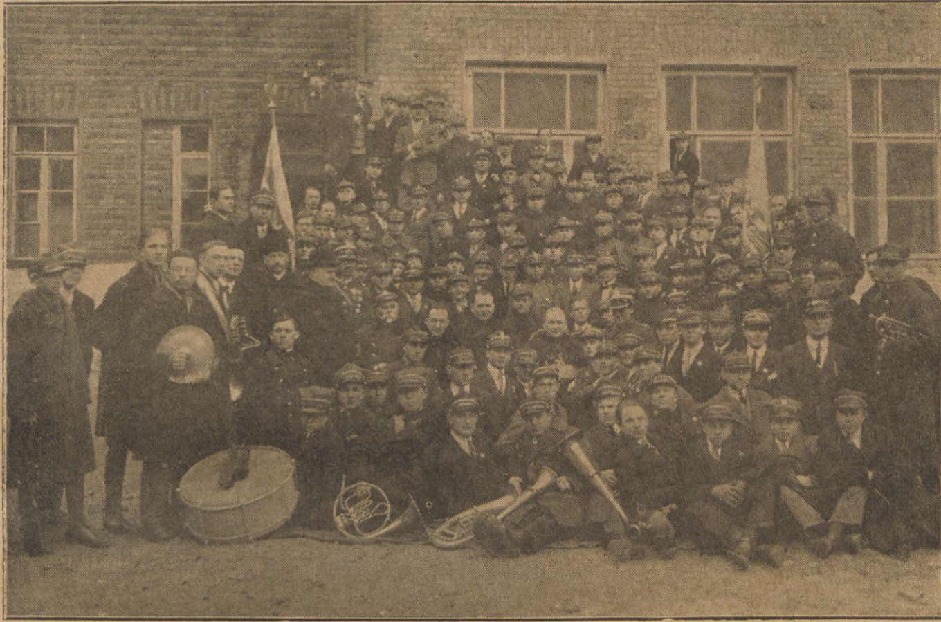
Kurs Wychowania Fizycznego i Kulturalno Oświatowy zorganizowany przez Związek Młodzieży Polskiej we własnym lokalu w Wilnie. Zakończenie kursu.