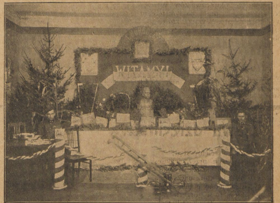
Wystawa przysposobienia rolniczego S.M.P. w Choroszynie. Pawilon kurkurydy. Na pierwszym planie nagroda zdobyta przez zespół konkursowy.

Związek Młodzieży Polskiej doceniając dalszy rozwój pracy w kierunku rolniczym, z jednej strony dąży do nawiązania najściślejszego kontaktu z fachowym personelem rolniczym, we wszystkich powiatach, objętych terenem działalności. Związku z drugiej zaś strony dąży do obsadzenia stanowisk instruktorów organizacyjnych na