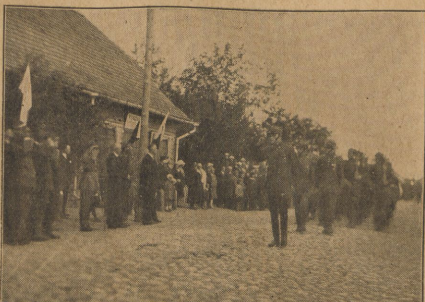
Defilada hucła Przysposobienia Wojskowego S.M.P. w Brasławiu.

Przetworzył masz młodości swej cnych kruszców war Na ścięgni stal, na złoto serc, na ducha spiz; Chwyć myśli młot i kuj i krzesz uczucia żar, Aż zmociesz lęk i w dłoni twej udźwigniesz krzyż. I staną masz, gdzie czelna brać ojczystych wart I czoło wzniesie i hasła nieść i znieść swój trud; Chwyć czynu miecz i ostrz i krzep wytrwania hart, Aż zceźnie wróg i wskrzeszon duch ujawni cud.