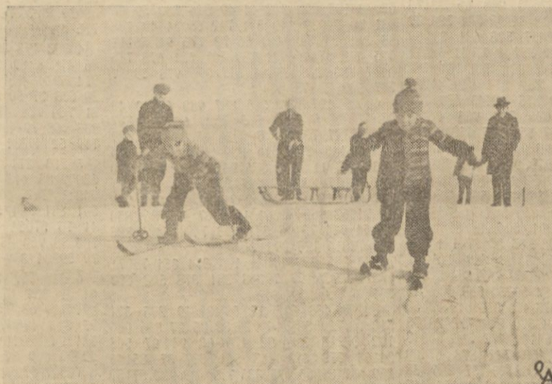
Wszyscy na narty — oto hasło, które chętnie wyznają nawet najmłodszy.