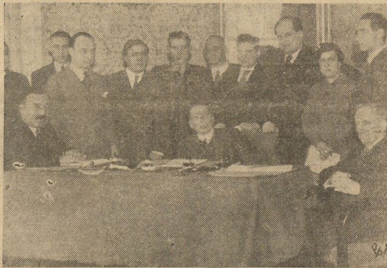
Członkowie Stałej Rady Małej Ententy ministrowie Jewlić (Jugosławia), Titulescu (Rumunia) i Benez (Czechosłowacja) w otoczeniu przedstawicieli prasy na pierwszym tegorocznym posiedzeniu Rady w Lublanie.