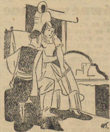
OPERA ST. MONIUSZKI W RADJO WE WTOREK 25. VI. O GODZ. 21.00