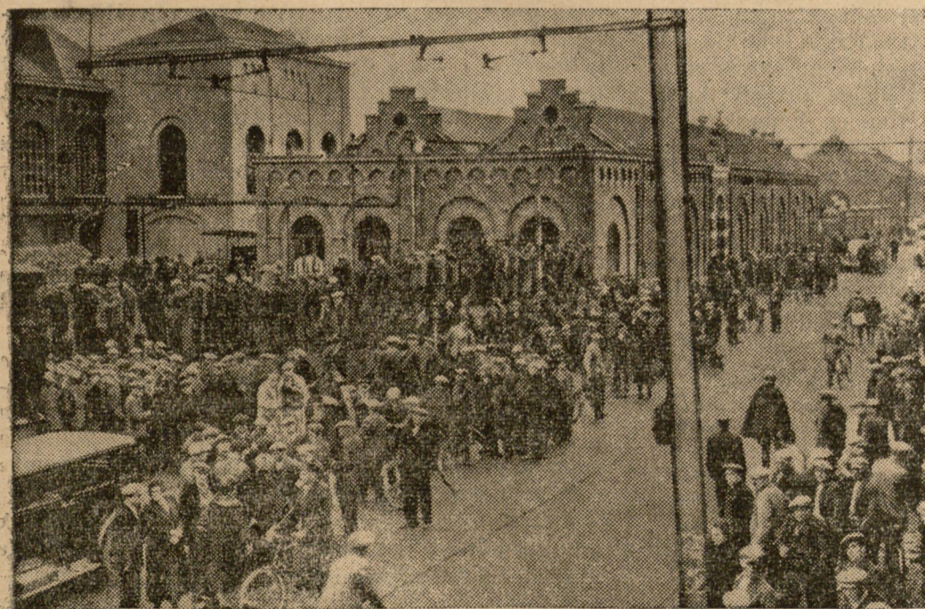
W La Bouwerie, w Belgji, zdarzyła się katastrofa w kopalni, w której 11 górników zostało zabitych, 30 odniosło rany, 11 zaś zostało jeszcze w szybach. Niema nadziei, by udało się ich stamtąd uratować. Na ilustracji — fragment z pogrzebu ofiar katastrofy. —

Rutynowany NAUCZYCIEL MUZYKI udziela lekcji GRY NA FORTEPIJANIE — Ceny przystępne. — ul. Jagiellońska 8 m. 22, godz. 4—6 pp.