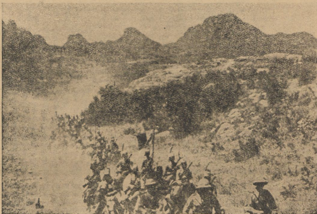
Nieprzeliczone kolumny wojsk włoskich dzień i noc posuwają się naprzód po trudnym górskim terenie.