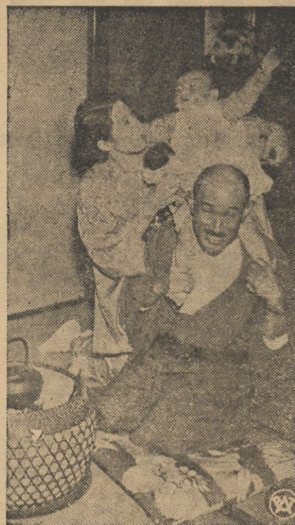
Dowódca marynarki japońskiej wiceadmirał Sankichi Takahashi w życiu prywatnym w otoczeniu najbliższej rodziny.