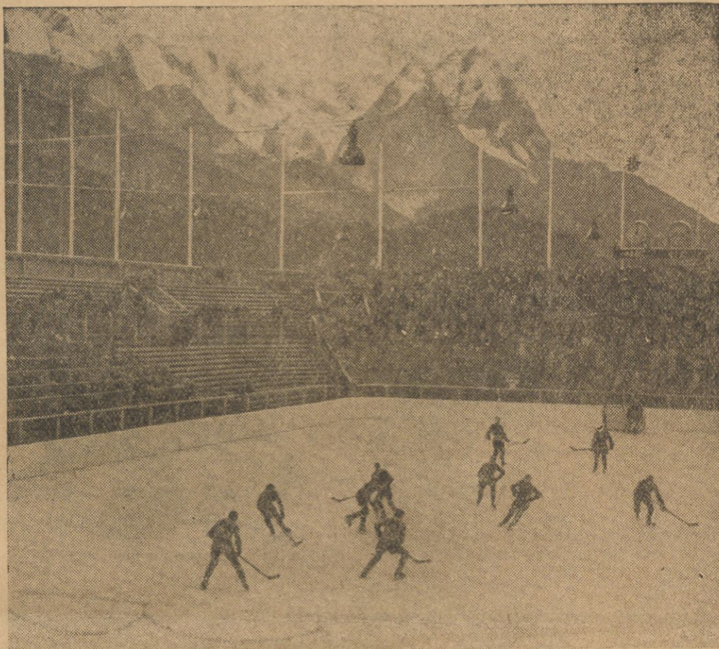
Sekretarz stanu Pfundtner otworzył w Garmisch-Partenkirchen olimpijski stadjon lodowy (ze sztucznego lodu). W dniu otwarcia na stadionie odbyły się zawody hokejowe między drużynami berlińską i bawarską.