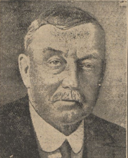
ARTUR HENDERSON Przewodniczący Konferencji Rozbrojeniaowej.

Anglja domaga się od Francji dodatkowych wyjaśnień.