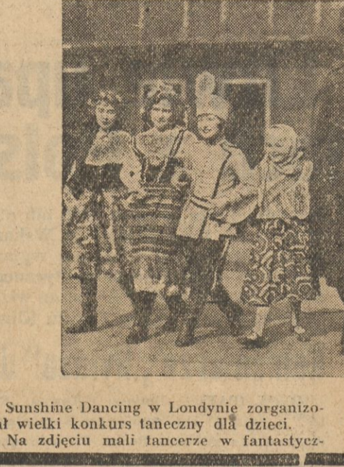
Sunshine Dancing w Londynie zorganizował wielki konkurs taneczny dla dzieci. Na zdjęciu mali tancerze w fantastycznych kostiumach...