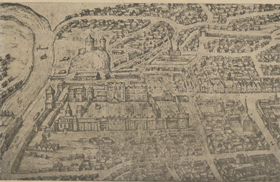
Wygląd Zamku dolnego według miedziorytu Hohenberga z XVI w. (z atlasu Brauna)

nych przez Rosjan miało swój cel. Dążono do niego uparcie i wytrwale. Między innymi pozostałe zabudowania Zamku dolnego koło Katedry, u wylotu ul. Zamkowej zniszczone doszczętnie. K w kwietniu 1837 roku na pustem polu stała tylko sama Katedra.