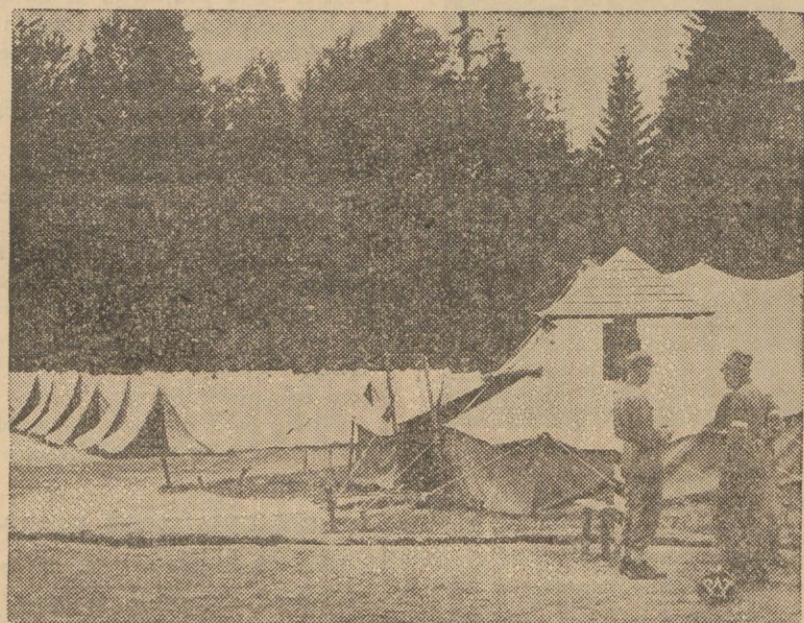
Obóz żołnierski w lesie.

chorążych Piechoty. Po ćwiczeniach wojskowych dziennikarze udali się na teren obozu położonego wśród pięknych lasów sosnowych, gdzie zapoznali się z wzorowymi i zdrowotnymi urządzeniami.