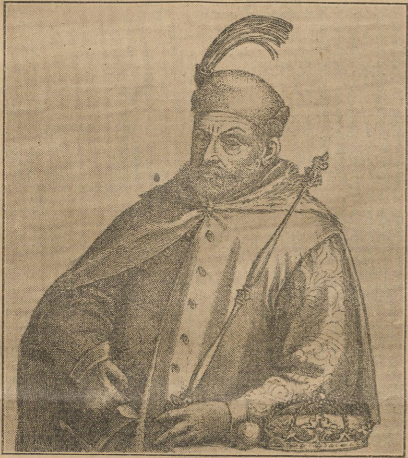
STEFAN I-SZY KRÓL POLSKI, WIELKI KSIĄŻĘ LITEWSKI Ruski, Pruski, Mazowiecki, Zmudzki, Inflancki, Kijowski, Smoleński, i Czernichowski Książę, Starosta Spiski.