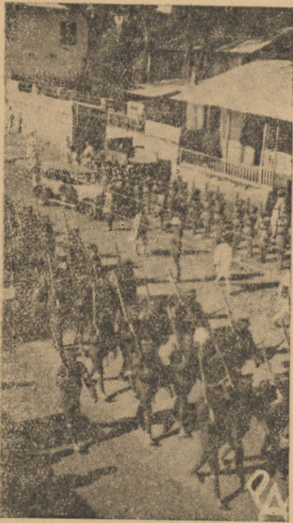
Wojska abisyńskie w marszu na ulicach Addis-Abeby.

Państwowość Abisynji oparta jest od wieków na systemie patriarchalnym. Najniższą jednostką w tym systemie jest rodzina, należąca do plemienia, na którego czele stoi naczelnik, często książę z zamierzonej dynastji, o której początku nawet legenda niewiele mówi.