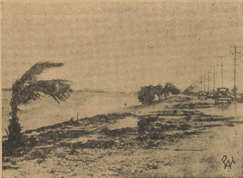
Florydę nawiedziły ostatnio gwałtowne burze, połączone z huraganem. Liczba ofiar w ludziach przekroczyła setkę. Na zdjęciu — wybrzeże Florydy podczas huraganu.