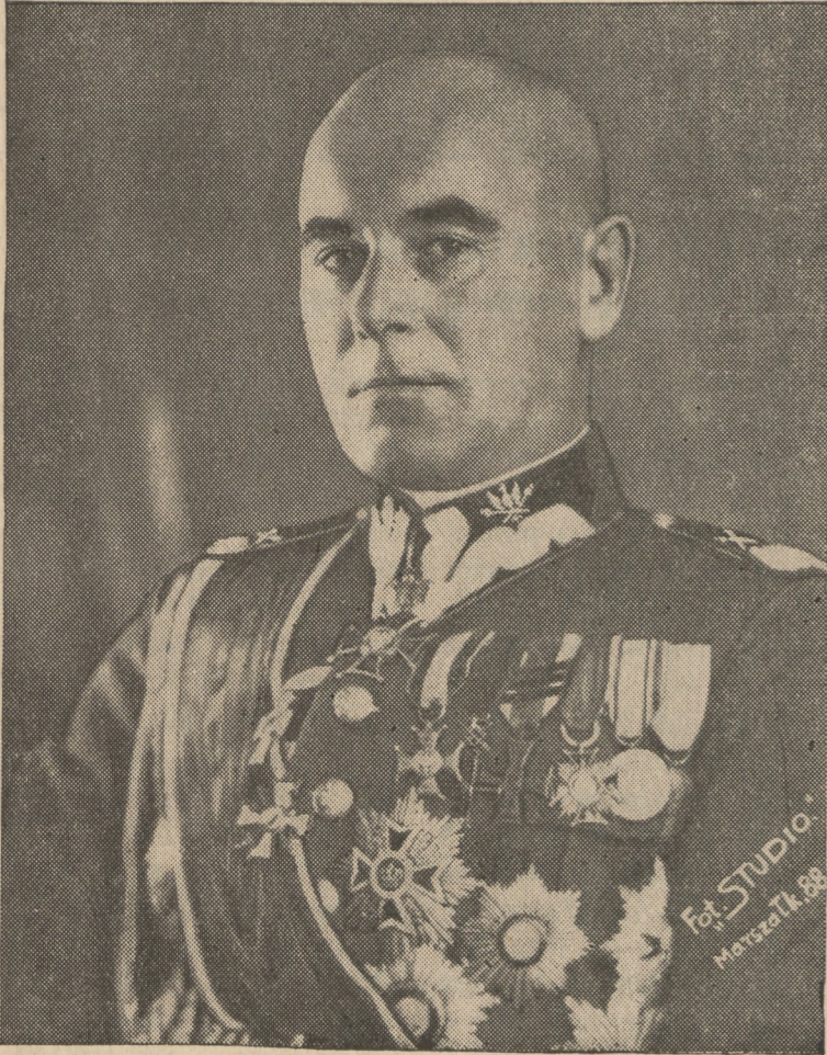
[Marszałek Polski EDWARD ŚMIGŁY-RYDZ.]