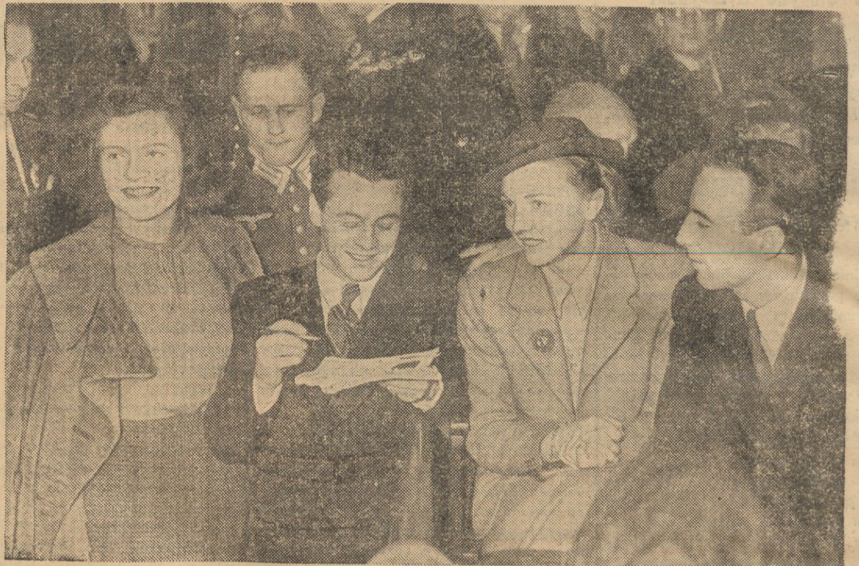
Pewnemu reporterowi niemieckiemu udało się „przylapać” w berlińskim „Sportpalast” czwórkę mistrzów świata w jeździe figurowej na lodzie. Od lewej: Angielka Megan Taylor, Austriak Feliks Kaspar oraz niemiecka para — panna Herber i Ernst Baier.

Mecz rozpocznie się punktualnie o godz. 17 min. 30. Ilość miejsc w sali Ośrodku WF będzie ograniczona. Warto więc nie spóźniać się.