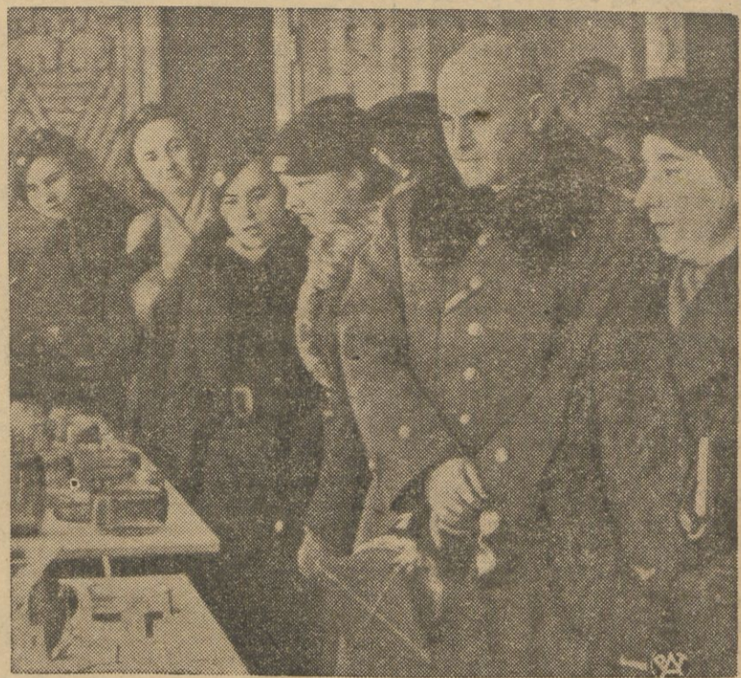
Marszałek Polski Edward Śmigły-Rydz zwiedza wystawę szwedzkiego przemysłu artystycznego, urządzoną w salonach Instytutu Propagandy, Sztuki w Warszawie

Marszałek Śmigły-Rydz na wystawie szwedzkiej