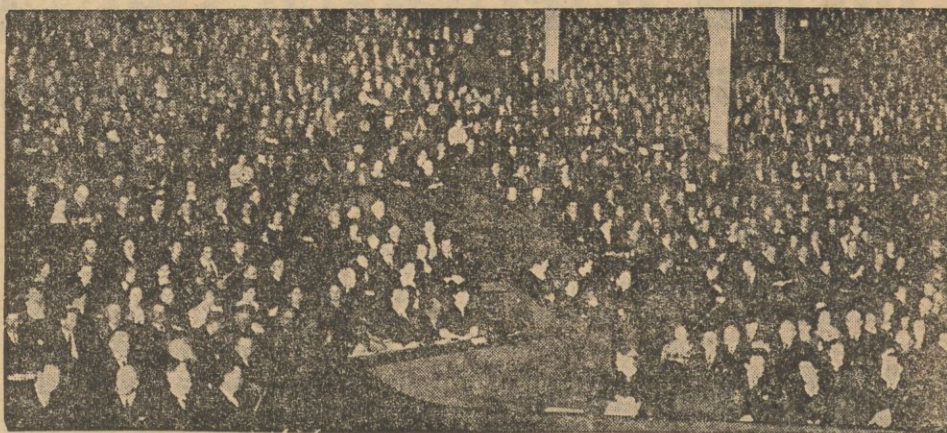
Ogólny widok na salę.