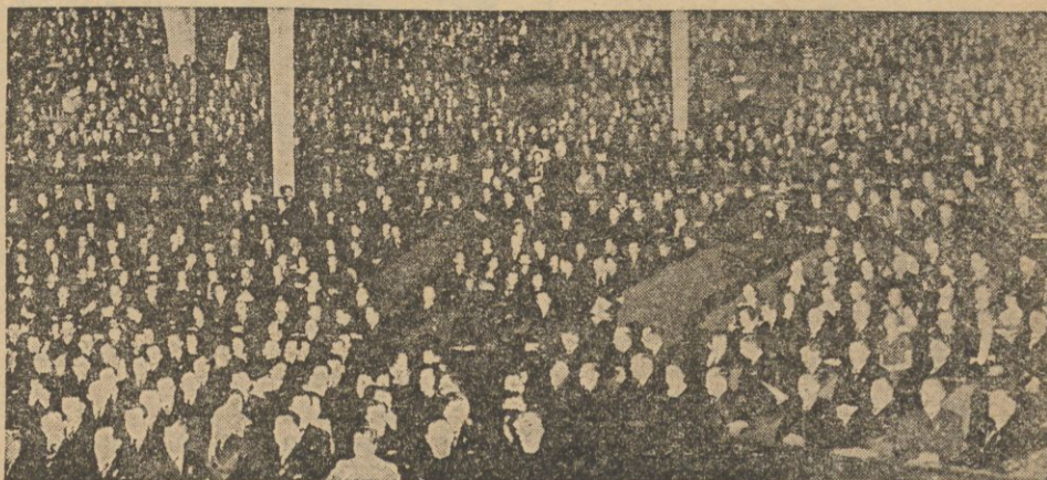
Na sali 5 tysięcy delegatów.