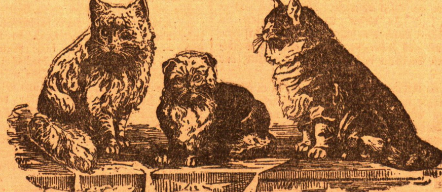
1. Weiße Angora 2. Eyperkatze 3. Blaue persische

verfallen war, der eine Katze schlachtete oder mit Willen tötete. Im 5. Jahrhundert n. Chr. wurde die Katze in Italien eingeführt. 8. kam sie nach Deutschland, wo sie aber noch im 14. Jahrhundert eine Seltenheit bezeichnet wurde. War zuerst ihre wirtschaftliche Bedeutung ausschlaggebend in ihrer Anschaffung, so entwickelte sich nachher ein gewisser Sport in der Haltung von Katzen. Bei Beobachtung der mannigfaltigen, schönen Farbzusammenstellungen und der Verschönerung gewisser lebenswürdiger Eigenschaften Weisen der Katzen, richtete der Kulturmenschen sein Augenmerk gar auf die verschiedensten anderen Arten von Katzen, um diese als Katzen, als Luxustiere in sein Haus aufzunehmen. Die hellgraue Eyperkatze (Abb. 2), eine Bewohnerin der kannten Insel Cypern, forderte billig die Verehrung heraus. Seltener waren blauegraue Arten, wie gewisse persische (Abb. 3),