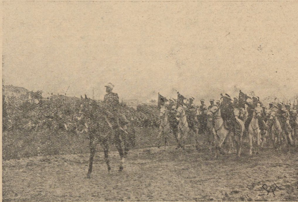
Orkiestra 1 p. szwoleżerów, mijając trumnę Wodza przykłada do ust trąbki, z których jednak nie ulatuje żaden dźwięk...