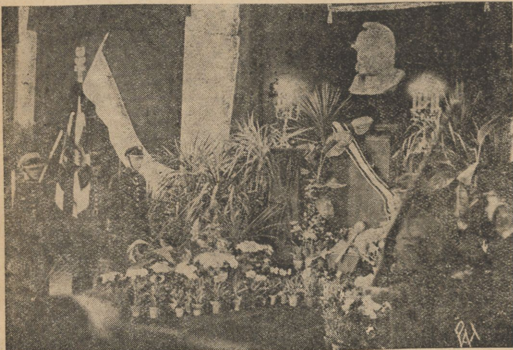
Wnętrze Kaplicy Żałobnej Marszałka Piłsudskiego, urządzonej w gmachu Urzędu Wojewódzkiego w Kielcach.

* J. Piłsudski, Gesetz und Ehre, Eugen Diederichs Verlag 4 nlb + 223 + 1 nlb, 4 portrety i 3 mapy.