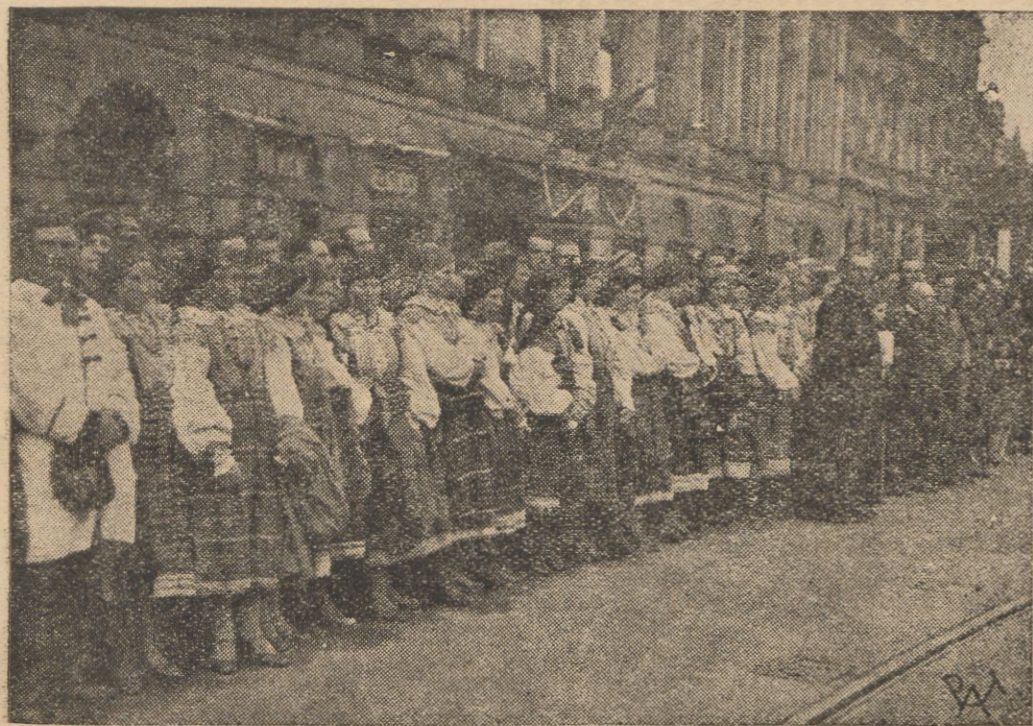
Na uroczystości pogrzebowe przybyły tłumnie delegacje młodzieży wiejskiej, które ustawiły się szpalarami wzdłuż ulic, które przecięgał k ondukt.