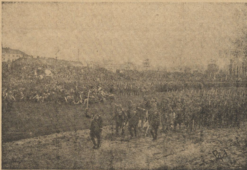
Ostatnia defilady piechoty.