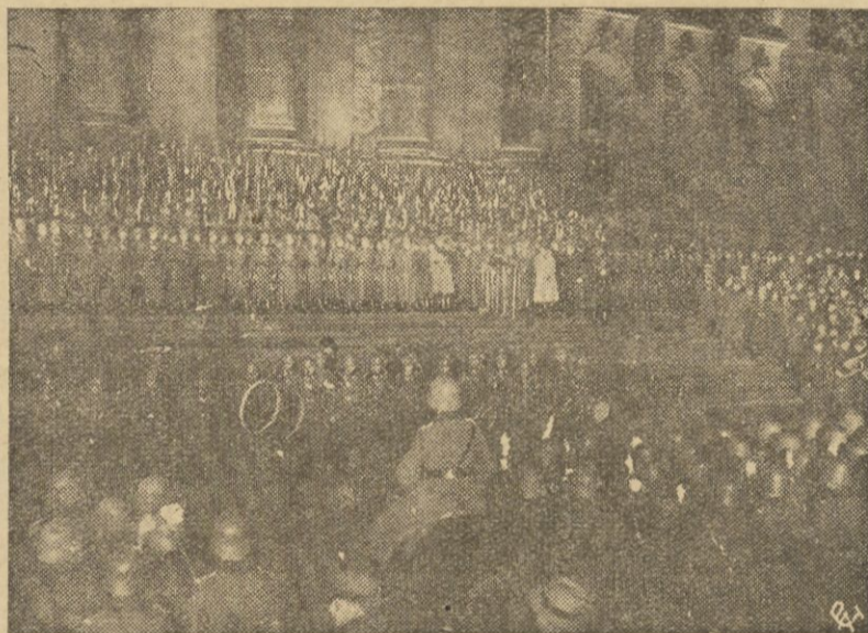
Wynik plebiscytu w Zagłębiu Saary powitany został z entuzjazmem w całym Niemczech. Na zdjęciu — moment manifestacji w Berlinie urządzonej dla zadokumentowania radości spowodowanej wynikiem plebiscytu.