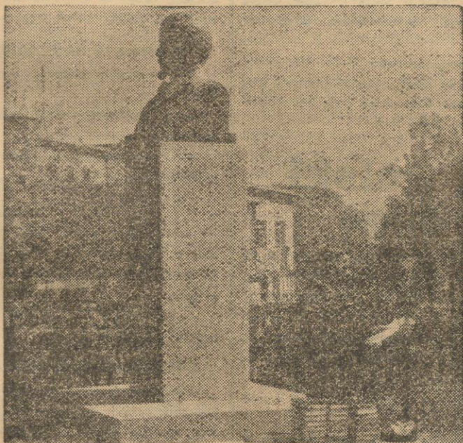
Pomnik ku czci znakomitego pisarza Henryka Sienkiewicza, odsłonięty ostatnio uroczysto nad polskim Bałtykiem w Gdyni.