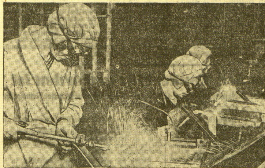
Frauen im Alltag Eine Photokubie aus einer Fabrik die junge Arbeiterinnen am Schweißapparat zeigt.

Unter den mancherlei Ansprüchen, die in London