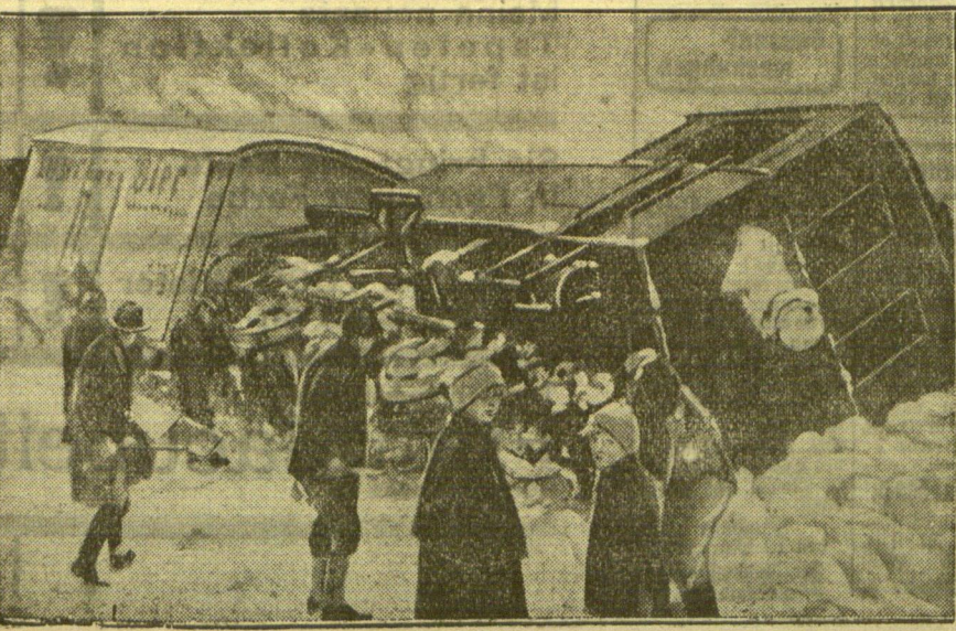
Salvine führt Eisenbahnzug um Auf der Brünig-Bahn-Strecke von Interlaken nach Lugern ging bei Lugern eine mächtige Salvine zu Tal, gerade als ein Zug die Strecke passierte. Wie ein Spielzeug wurde der Zug umgeworfen.

Rotationsdruck und Verlag von F. W. Siebert, Memeler Dampfboot Aktiengesellschaft. Hauptschriftleiter und verantwortlich für den gesamten redaktionellen Teil Martin Kakies, für den Anzeigen- und Reklamenteil Arthur Hippo, beide in Memel.