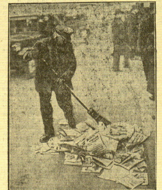
Nach der Wahl... Die letzten Spuren des Wahlkampfes werden beseitigt.

wlb. Lissa, 16. März. Infolge plötzlich einsetzenden Tauwetters ist der Kuban-Fluß über seine Ufer getreten. Ueber 50 Dörfer stehen unter Wasser.