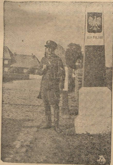
Żołnierz Straży Granicznej na posterunku przy słupie granicznym.