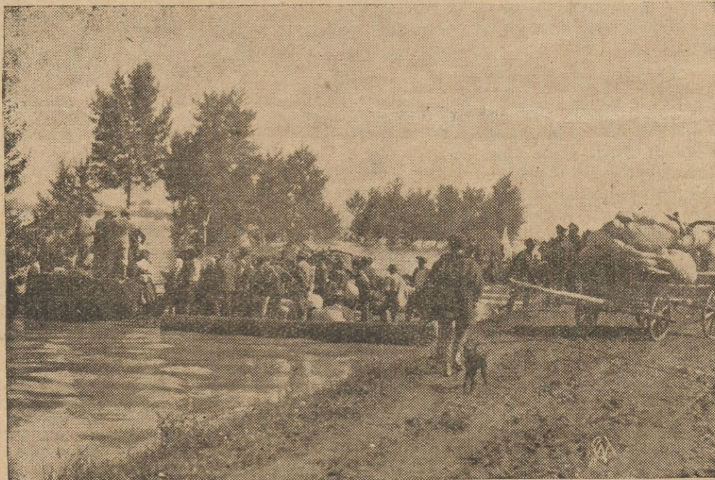
Ratowanie dobytku nieszczęśliwych powodziar