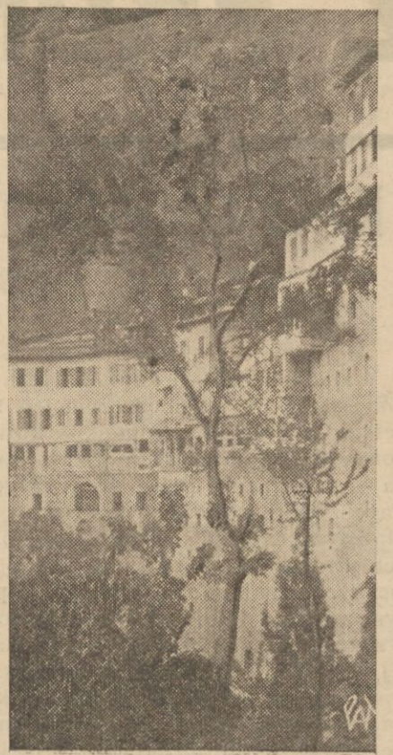
Słynny klasztor grecki Mega Epilion spalony doszczętnie