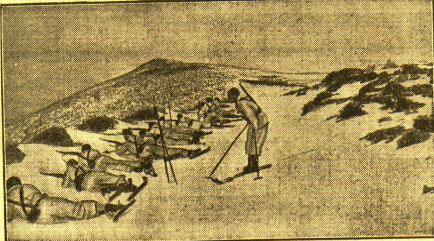
Die Kämpfe in Spanien In der Sierra Nevada an der Granadafront sind auf Seiten der nationalspanischen Armee auch Gebirgstruppen eingesetzt, die durch ihre hervorragende Ausbildung wertvolle Aufklärungs- dienste leisten. — Die Patrouille hat den Feind gesichtet.

Links: Chauffeebäume, die einzige Orientierung auf dieser Landstraße Das Hochwasser der Donau bei Straubing hält immer noch unermindert an. In einer Ausdehnung von 30 Kilometer Länge und etwa 7 Kilometer Breite sind Seebäder und Wälder in einen tiefen See verwandelt