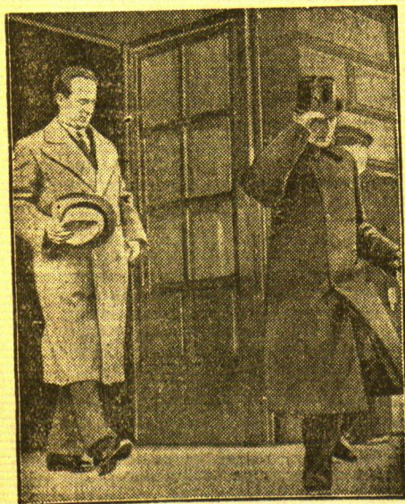
König Leopold von Belgien in Stockholm König Leopold von Belgien trat heute in Stockholm ein, um an den Geburtstagsfeierlichkeiten seines Schwiegervaters, des Prinzen Karl von Schweden, der jetzt 76 Jahre alt wird, teilzunehmen. Am Bahnhof wurde der König (links) von dem Prinzen Karl von Schweden (rechts) begrüßt.