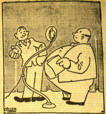
Die Sendeleitung ist entgegenkommen „Wie Sie sehen, haben wir Ihre Wege ein besonderes Mikrophon angehängt.“

Da schleiften denn die Genossen diesen grandiosen Erfinder MacCoy, den Schöpfer eines neuen, noch nie dagewesenen Rauschtranks, in seine Hütte, und sie probierten ebenfalls von der neuen „Arznei“ — und zwei Stunden später gab es, zum rätselbanger Entsetzen der braunen Frauen und Kinder,