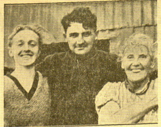
Der einzige Überlebende der Katastrophe der „Poutanoui-pas“

Jede Nacht schlagen wir ein regelrechtes „Camp“ auf. Mein offenes Zelt steht in der Mitte. Rund