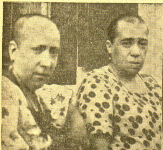
Die nationalen Truppen dulden keinen Separatismus. Beim Einmarsch der Truppen der nationalen Erhebung in San Sebastian versuchten diese beiden basquischen Frauen eine separatistische Demonstration für eine unabhängige basquische Republik. Zur Strafe schnitten ihnen die Soldaten die Haare ab — in Veranschaulichung der Strafmaßregeln der Roten eine gelinde Sühne.