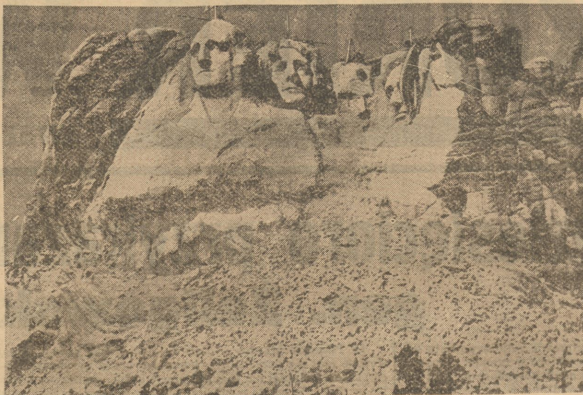
Największy pomnik Ameryki w Południowej Dakocie: gigantyczne, rzeźbione w skałach głowy prezydentów Abrahama Lincolna, Jerzego Washingtona i Tomasza Jeffersona. Poświęcenie tego pomnika odbyło się w tych dniach. Prace nad wy-konaniem pomników zostały wykonane pod kierownictwem znanego duńsko - amerykańskiego rzeźbiarza Gutzon Borgtuma.